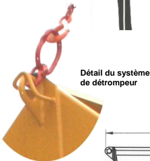
Détail du système de détrompeur