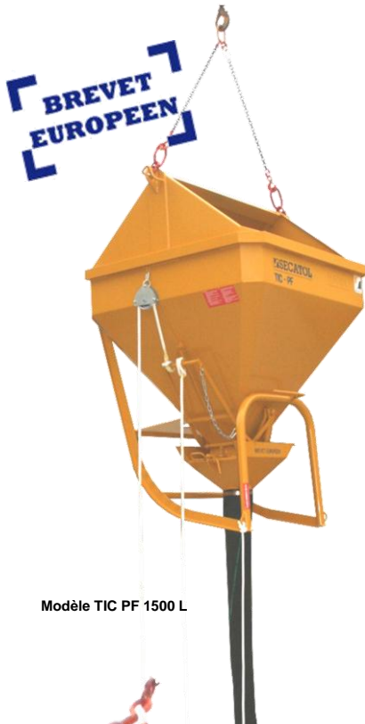
Modèle TIC PF 1500 L